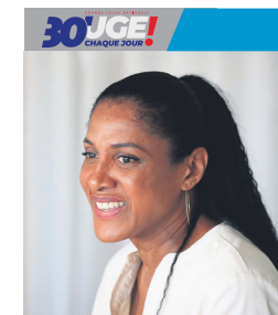
Marie-José Pérec, triple championne olympique

«Je milite pour cette grande cause que représente le sport, le sport qui crée un rêve, qui donne une chance, le sport qui nous rassemble, le sport qui fixe des objectifs, qui pousse au dépassement, malgré les échecs, le sport qui est une école de la vie.»