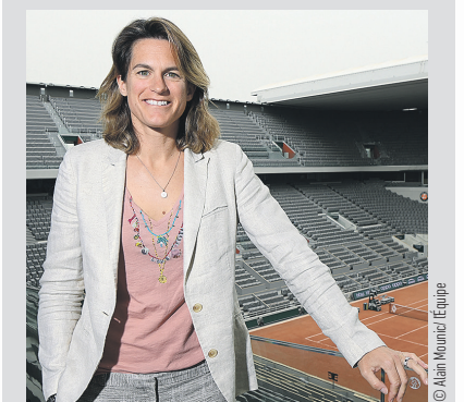
Amélie Mauresmo, directrice du tournoi de Roland-Garros

« Le sport est ma grande cause ; d'abord parce que c'est une passion mais aussi parce que le sport a vraiment forgé mon caractère. Il m'a donné goût aux défis, aux challenges. Si je ne voulais pas forcément à tout prix devenir numéro un mondiale – et je l'ai été en 2004 et 2006 ! –, le sport m'a appris à aller de l'avant, toujours, à me dépasser même, et à ne rien lâcher pour atteindre un objectif. Pour cette raison, je milite afin que le sport devienne cet accompagnateur fidèle, cet ami quotidien qui nous aide à grandir continuellement, à garder confiance, sur le terrain comme dans tous les lieux de la vie. »