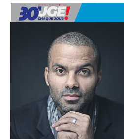
Tony Parker, ancien joueur NBA et président de l'Asvel

«Pour se maintenir en bonne santé, les seniors ont tout intérêt à varier les types d'exercices physiques. Il leur est tout d'abord conseillé de marcher ou de pratiquer une activité à impact, afin de monter un peu en intensité et d'entretenir leurs os ainsi que leur système cardiovasculaire. Des exercices de renforcement vont leur permettre par ailleurs d'entretenir leur masse musculaire. Enfin, ils peuvent réaliser des activités de souplesse en réalisant des étirements ou en pratiquant le yoga.»