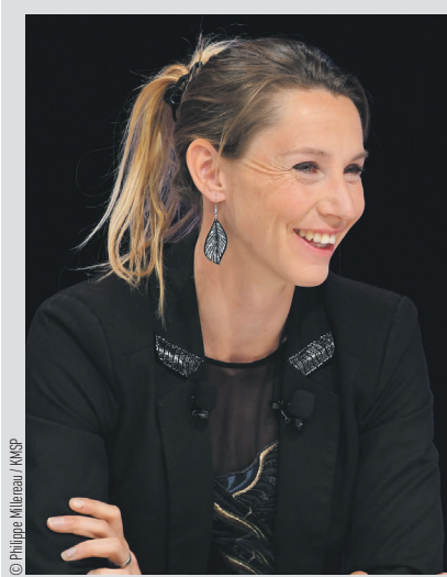
Marie-Amélie le Fur, détentrice de 9 médailles aux Jeux paralympiques

Parce que le sport est au cœur de ma vie depuis si longtemps, je sais qu'il est l'un des instruments au service de l'émancipation, du bien-être personnel et collectif le plus puissant qui soit. Pour qu'il soit encore plus présent dans la vie de tous les Français, nous avons besoin de toutes les forces vives du pays. Rejoignez les militants du sport!