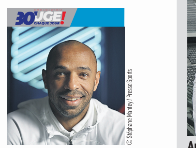
Thierry Henry, sélectionneur de l'équipe de France espoirs de football

Bouger au quotidien permet de limiter les risques de maladies chroniques comme le cancer, l'obésité ou le diabète de type 2 mais aussi de maladies cardiovasculaires. L'activité physique est ainsi un levier important de prévention de l'infarctus du myocarde, des accidents vasculaires cérébraux et de l'hypertension. De même, une activité physique adaptée à la pathologie est recommandée lorsque l'on est touché par certaines maladies chroniques, en parallèle des traitements médicaux. Le sport permet également de limiter le risque de récurrence, par exemple lorsque l'on est en période de rémission d'un cancer.