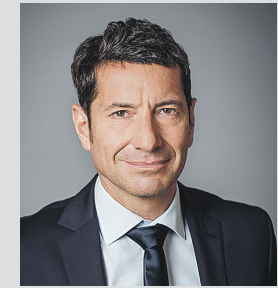
David Lisnard, maire de Cannes et Président de l'Association des maires de France et des présidents d'intercommunalité (AMF)

Les élus locaux sont des partenaires essentiels de l'activité sportive. D'une part, les villes et villages de France sont les premiers financeurs du sport avec plus de 11 milliards d'euros cumulés; d'autre part, l'échelon local permet de valoriser et promouvoir l'activité physique au plus près des Français. Depuis plusieurs années, l'AMF travaille pour espérer la réussite des Jeux et pérenniser leur héritage. L'élan donné doit permettre de répondre aux défis