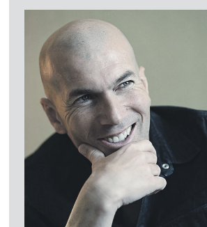
Zinedine Zidane, entraîneur et ancien footballeur international