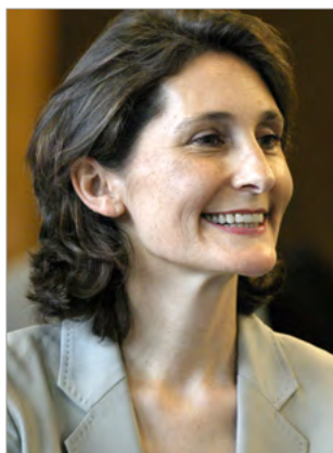
Amélie Oudéa-Castéra Ministre des Sports et des Jeux Olympiques et Paralympiques