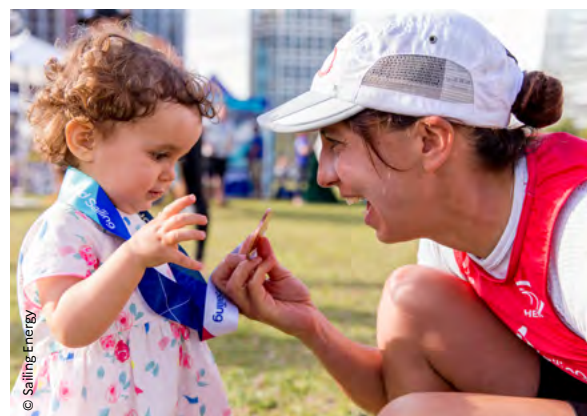
Charline Picon, championne olympique de planche à voile RS:X et maman

« Pendant toute ma grossesse, l'envie de poursuivre le sport de haut niveau était forte, mais j'avais malgré tout ce point d'interrogation sur ce qu'il allait se passer une fois qu'elle serait dans mes bras et aussi si j'allais retrouver mon niveau. Mon préparateur mental m'a fait comprendre que je pouvais déconnecter du sport et de mon projet sportif pendant un moment et me connecter sur ce qui se passait en moi et avec l'enfant que je portais. Ca m'a vraiment libéré. »